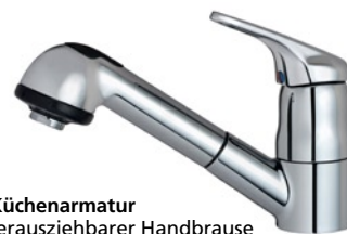
Mio Küchenarmatur mit herausziehbarer Handbrause B8829AA