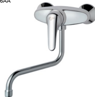
Mio Wand-Küchenarmatur mit Rohrauslauf 200 mm B8826AA