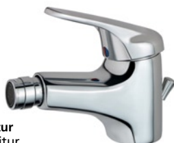
Mio Bidetarmatur mit Ablaufgarnitur B8823AA