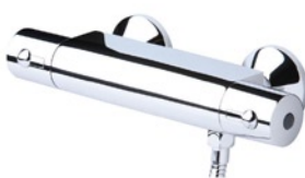
Mio Badethermostat Aufputz mit Brausekombination 90 cm A4777AA