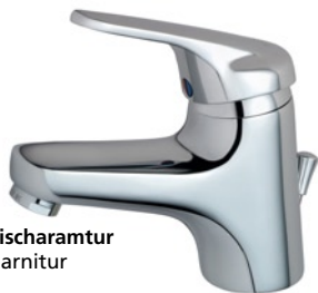
Mio Waschtischarmatur mit Ablaufgarnitur B8820AA